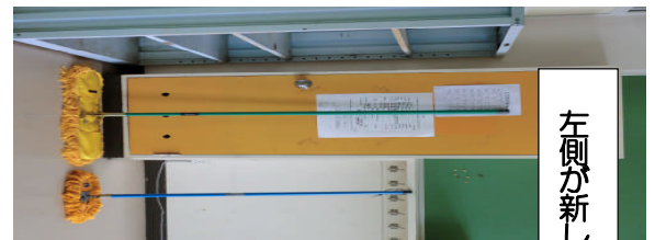
左側が新しいモップです！

子どもたちの掃除にかかわって昨年度、各教室で使っているモップが小さめであり、大きいものが良いのでは、という意見がありました。配当予算の執行状況を見て、残予算で購入できると判断、購入しました。モップ幅は今までのものは43(23.5)cm、新しいものは84(60)cmです。これからも教育環境整備の充実に努めていきたいと考えております。